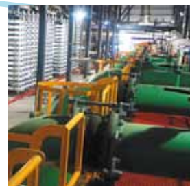
Usine de désalement d'eau de mer

Construire une unité de traitement d'eau potable fait appel à des disciplines très diverses telles que chimie, biologie, génie civil, architecture, automatisme... Nos entreprises sont là pour vous accompagner.