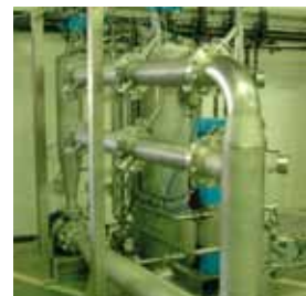
Ultrafiltration d'eau industrielle

Pour les besoins du cycle de l'eau chez l'industriel, les entreprises du SIEP ont su développer et réaliser des procédés performants capables de répondre aux variations qualitatives et quantitatives de l'eau à produire.